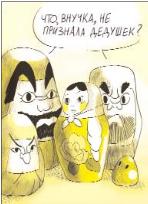
Рисунок Кристины Звездинской

– Ребята, мне хочется предложить кому-нибудь из вас сейчас попробовать себя в роли экскурсовода. Это очень ответственная работа. Кто мо-